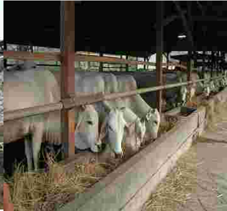
Gambar 5. Usaha pembibitan sapi potong yang menggunakan jerami padi sebagai sumber pakan serat