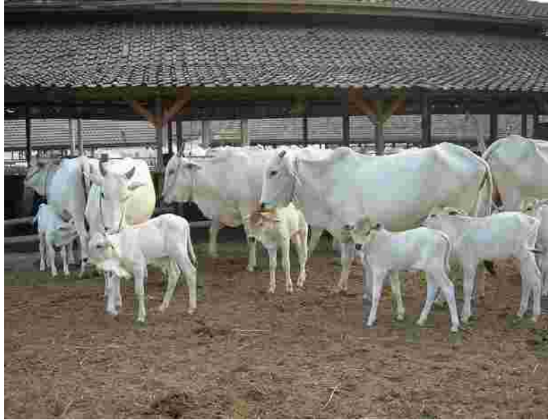
Gambar 8. Usaha pembibitan sapi potong dengan teknologi inovasi pakan murah