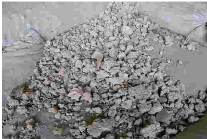
Gambar 2. Onggok (gamblong)

Tepung galek dan onggok mempunyai kadar energi yang tinggi, hampir menyamai jagung, akan tetapi rendah kadar protein maupun asam amino. Tepung galek maupun onggok tergolong sebagai karbohidrat yang mudah dicerna. Hasil ikutan singkong yang banyak digunakan sebagai bahan pakan ternak diantaranya adalah onggok (gamblong), galek afkir dan tepung tapioka afkir.