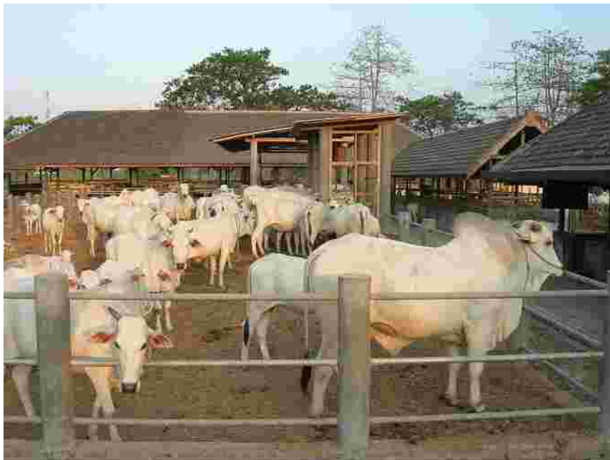
Gambar 6. Pemeliharaan sapi induk dan pejantan terpilih dalam kelompok