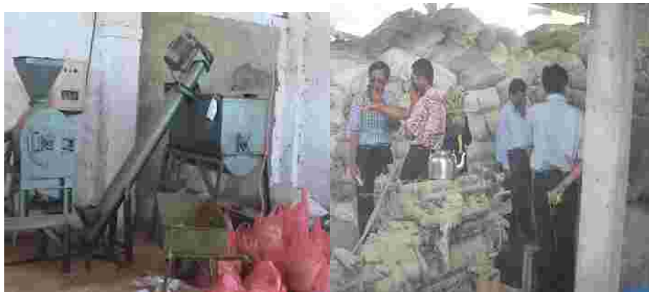
Gambar 7. Pabrik Pakan Komplit/ Lengkap (Complete Feed)

Teknologi “pakan murah” komplit telah dikembangkan dan diadopsi secara komersial oleh pabrik pakan Prima Feed di Pasuruan Jawa Timur sejak tahun 2002. Pakan komplit merupakan campuran dari limbah agroindustri, limbah pertanian yang belum dimanfaatkan secara optimal sehingga ternak tidak perlu lagi diberi hijauan. Mudah diduplikasi di setiap sentra peternakan dengan memanfaatkan potensi bahan pakan lokal dengan menggunakan mesin pencampur sederhana serta ramah lingkungan sehingga harganya sangat murah.