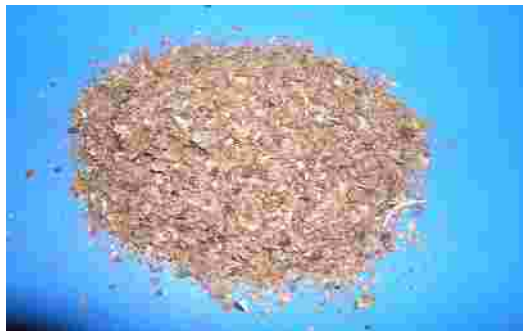
Gambar 1. Kulit Kopi

Pemanfaatan kulit kopi sebagai pakan ternak digunakan sebagai pupuk organik pada perkebunan kopi, coklat atau pertanian lainnya. Pada usaha pembibitan, kulit kopi dapat menggantikan konsentrat komersial hingga 20%.