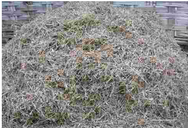
Gambar 3. Jerami kedelai

Selama ini hampir 50% jerami padi dibakar, abunya dikembalikan ke tanah sebagai kompos dan hanya 35% yang digunakan sebagai pakan ternak. Sistem integrasi ternak dengan tanaman pangan tidak hanya meningkatkan nilai tambah limbah pertanian yang dihasilkan, tetapi juga meningkatkan jumlah dan kualitas pupuk organik yang berasal dari ternak sehingga mampu memperbaiki kesuburan lahan.