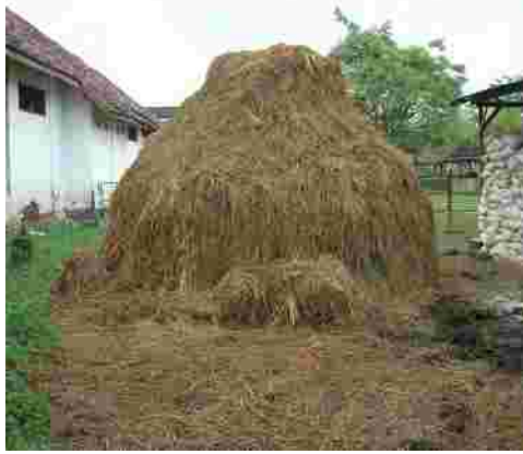
Gambar 4. Jerami padi sebagai pakan potensial dan